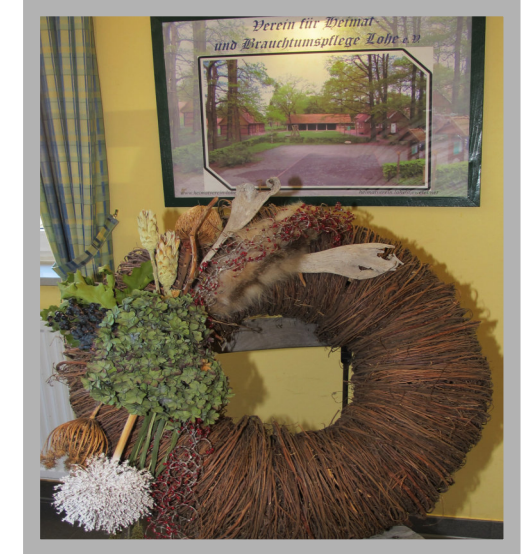
25 Jahre Heimatverein Lohe

Verein für Heimat- und Brauchtumpflege Lohe e.V.