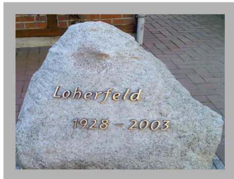
Loherfeld 1928 - 2003

75-jähriges Bestehen. Aus diesem Anlass wurde eine Festschrift herausgegeben. Im Jahr 2003 wurde in Eigenleistung und mit finanzieller Beteiligung der Loherfelder ein sehr schöner Glockenturm erstellt. Es ist ein echtes Schmuckstück für die ganze Gemeinde und Rasplatz für viele Radfahrer, die dort eine Pause einlegen. Im Rahmen der 75-Jahrfeier wurde noch ein großer Feldstein beim Glockenturm abgelegt.